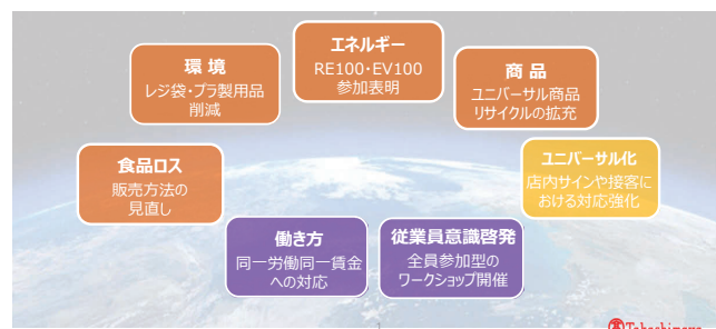
持続的成長に向けて取り組む7つの領域

重点課題のひとつである「排出CO2ゼロ」については、事業活動で使用する電力を2050年までに100%再生可能エネルギーにすることや、2030年までに直接管理車両を100%ゼロエミッション・EV化(電気自動車に置き換え)することにも取り組んでいる。2019年9月には、それらを進めるために「RE100」と「EV100」という2つの国際イニシアティブに参加した。同社グループは、脱炭素社会の実現を目指す「気候変動イニシアティブ」や、脱炭素社会への移行をビジネス視点で捉える日本独自の企業グループ「日本気候リーダーズ・パートナーシップ(JCLP)」などにも参加していることから、多くの企業・団体との接点が増え、ネットワークが広がったと感じているという。